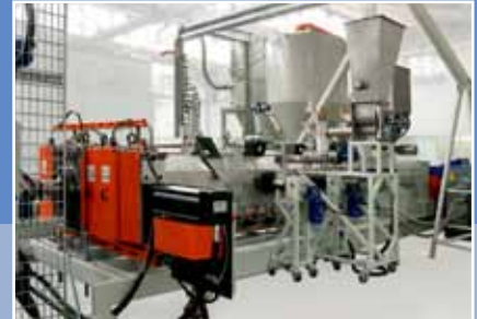
Микродозатор над экструдером