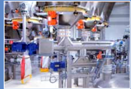
Виброднище и шнек с микродозированием